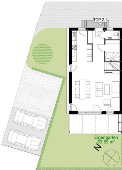
Erdgeschoss TOP 2.1